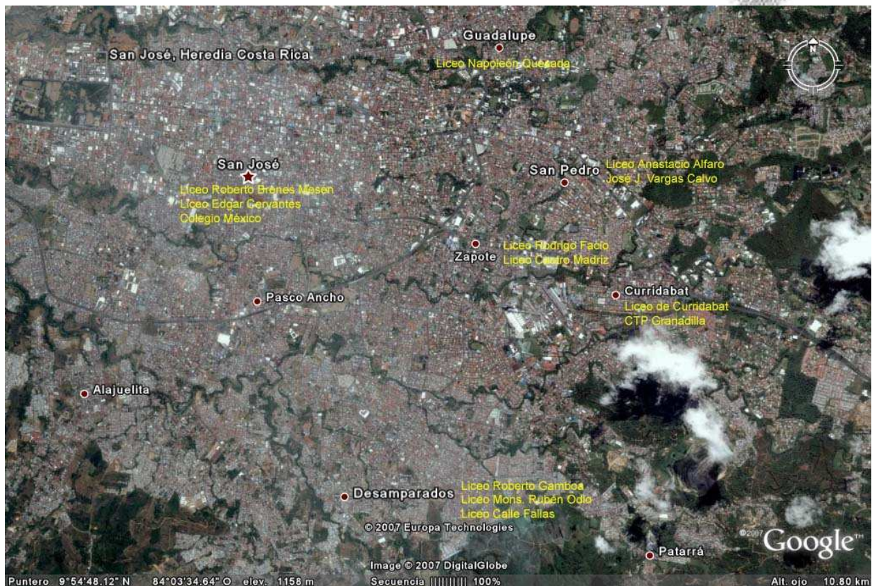
Mapa 1 Ubicación General de los Centros Educativos en el Gran Área Metropolitana

En los mapas 1 y 2 se detalla la ubicación general de los centros educativos.