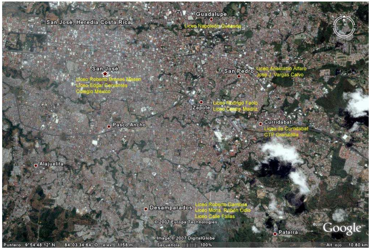
Mapa 1 Ubicación General de los Centros Educativos en el Gran Área Metropolitana